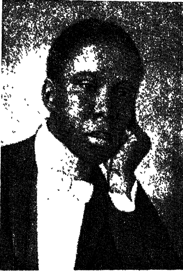
पाल लरिन्स इनवर